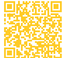
Sang og musik

ON, 23. FEB, KL. 19:00-21:00 KULTURCENTER MARIEHØJ, HOLTE 6 GANGE, KR. 450